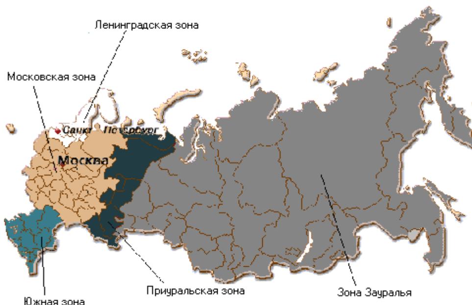
Таблица №1. Отгрузки цемента с ведущих цементных заводов России в первом квартале 2006 года: